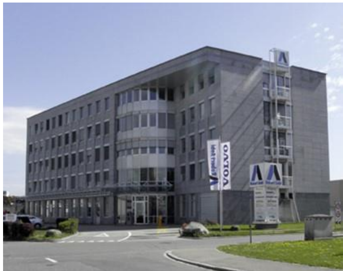
Das moderne Bürogebäude der Robert Aebi AG in Regensdorf

Für Verpflegungsmöglichkeiten ist gut gesorgt. Im eigenen Personalrestaurant werden täglich zwei Menüs und viele verschiedene Salate angeboten. Ebenfalls in der Nähe befindet sich ein McDonald's, ein grosses Einkaufszentrum und sonstige Läden.